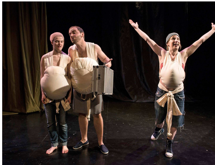
Quelques comédiens du GTA, à la Maison du Concert, lors de la dernière représentation de «Rudens, les naufragés».

Pour garantir leur réussite, la traduction des textes est primordiale. Confiée aux doctorants ou étudiants acteurs, elle fait l'objet d'une retranscription ardue sur plus d'une année. Or, tant du latin, que du grec ou français ancien, l'exercice est complexe. Pour éviter au public une vision plus historique que ludique, les écrits doivent être actualisés avec subtilité. Acteur